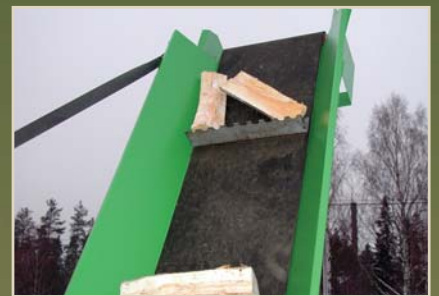
Leveä kuljetin ehkäisee tukoksia