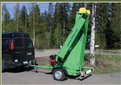
Kulkuri kulkee näppärästi