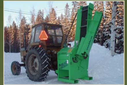
Nipussa valmiina kuljetukseen