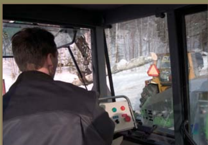
Koneen käyttöä mukavasti